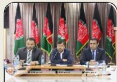
تلاش ها در راستای ساده سازی و بررسی اسناد ادامه دارد!... ۲

د شهیدانو او معلولينو په چارو کې د دولت وزیر ښاغلي لعل الدین آریوبي د کابل ښاروال ښاغلي محمد داود سلطانزوی سره لیدنه وکړه. یاده ناسته کې ښاغلي لعل الدین آریوبي د شهیدانو وارثینو او معلولیت لرونکو وگړو ستونزې او غوښتنې شریکې کړې. ښاغلي آریوبي وویل، په اداره کې د درې سلنه معلولين استخدام، دولتي ادارو او خدمتونو ته د معلولينو لاسرسی او دې قشر ته د لاسي څرخلاو د غرقو ویش باید د کابل ښاروالۍ په لومړیتوب کې وي تر څو ددوي اساسي ضرورتونو ته په وخت رسیدگي وشي. د کابل ښاروالۍ ښاروال ښاغلي محمد داود سلطانزوی له ښاغلي آریوبي څخه مننه وکړه او د شهیدانو وارثین او معلولیت لرونکي وگړي یې د هیواد ساتنې په لاره کې اصلي اتلان وبلل. ښاغلي سلطانزوی وویل، د شهیدانو وارثینو او معلولیت لرونکو وگړو ته د خدمتونو وړاندې کول د ښاروالۍ له اساسي او مهمو دندو څخه ده، چې په دې لاره کې یې د بشپړې هر اړخیزې همکارۍ ډاډ ورکړ او زیاته یې کړه چې د ښاري نظم د ساتنې په موخه د دواړو ادارو گډ کار او همغږي به زیاته شي.