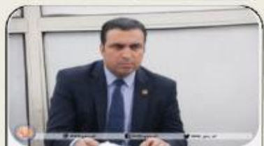
د اسنادو او وثیقو د څېړونکې کمېټې کاري بهیر باید چټک، روڼ او ژر نهایی شي... ۳