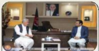
شفافیت و تسریع در کارهای اساسی افراد دارای معلولیت... ۴